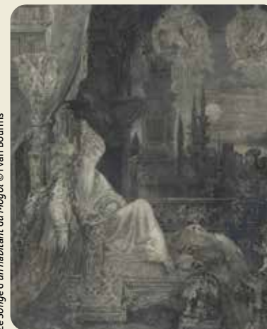
Félix Bracquemond, d'après Gustave Moreau, Le Songe d'un habitant du Mogol

Lieu : Musée-atelier Théodore Rousseau, 55 Grande Rue à Barbizon