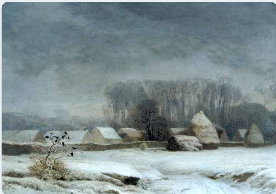
© Eugène Lavielle, Barbizon sous la neige, Musée des peintres de Barbizon

Avec Hélène Oblin, responsable du développement des publics et de l'action culturelle du musée