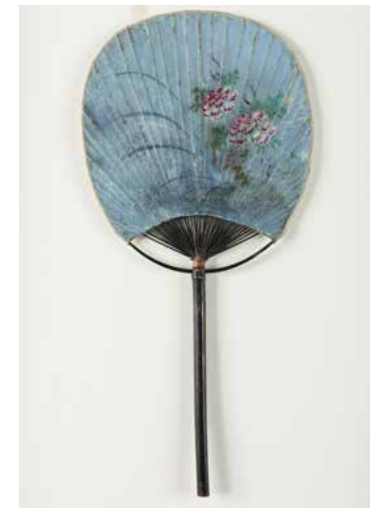
Anonyme Éventail bleu à décor floral Peinture sur papier et armure en bambou