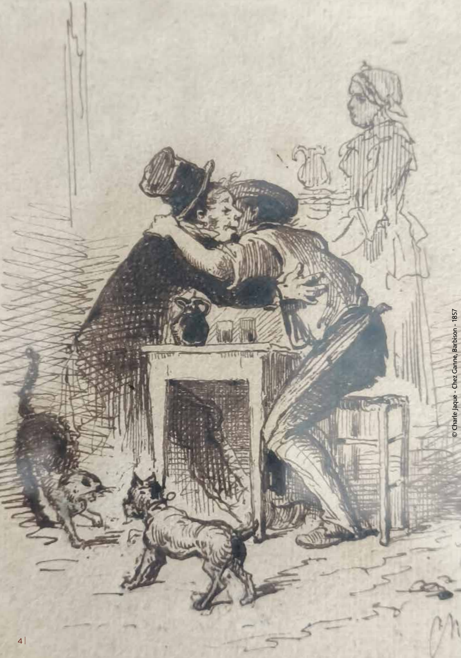
© Charles Jacque - Chez Ganne, Barbison - 1857

Enfin, la cinquième et dernière section ouvre une fenêtre sur le Japon, grand producteur dès le XVII e siècle des célèbres estampes. Ces œuvres raffinées, qui ont profondément influencé les artistes européens du XIX e siècle, viennent clore le parcours en offrant un regard élargi sur le dialogue entre les arts et les cultures.