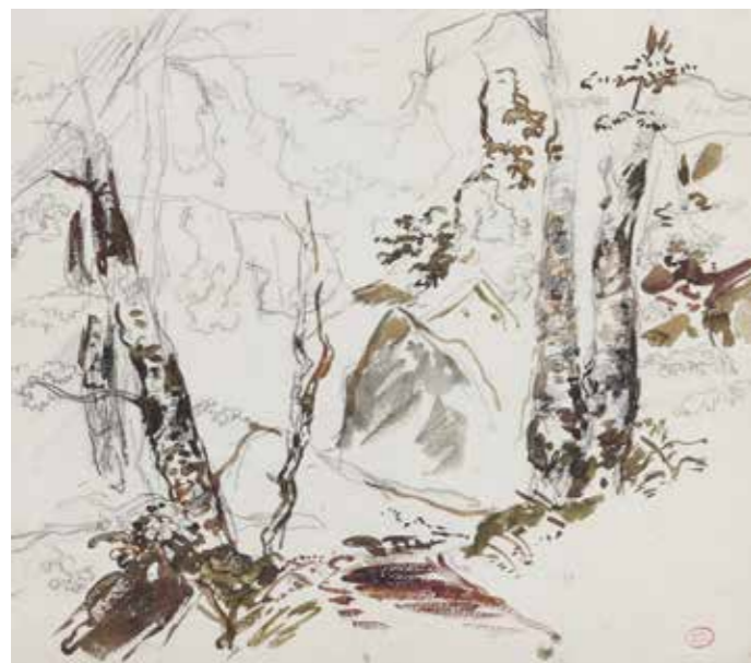
Paul HUET (1803 - 1869) Effet à Fontainebleau 1862 Aquarelle et crayon sur papier