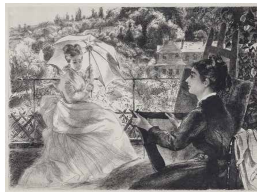
FELIX BRACQUEMOND (1833 - 1914) La terrasse de la Villa Brancas à Sèvres 1876 Gravure à l'eau forte, épreuve avant la lettre