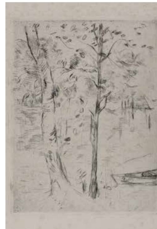
Berthe MORISOT (1841 - 1895) Le lac du bois de Boulogne ou Le nénuphar blanc 1888 Gravure à la pointe sèche