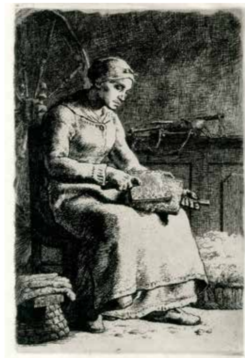
Jean-François Millet (1814-1875) La Cardeuse 1856 Gravure à l'eau forte